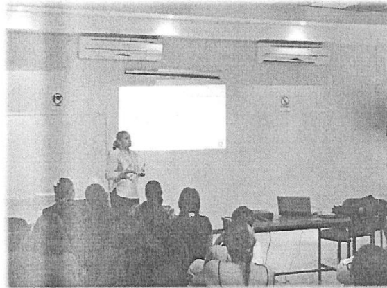
TALLER DE ACOSO Y HOSTIGAMIENTO SEXUAL, DIRIGIDO A FUNCIONARIO DEL GOBIERNO DEL ESTADO DE JALISCO