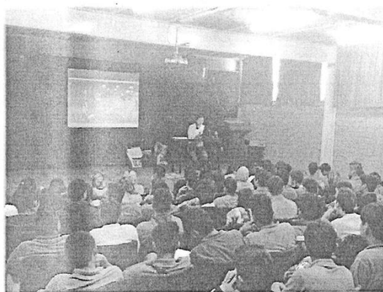
TALLER DE SEXUALIDAD Y PREVENCIÓN DEL EMBARAZO ADOLESCENTE