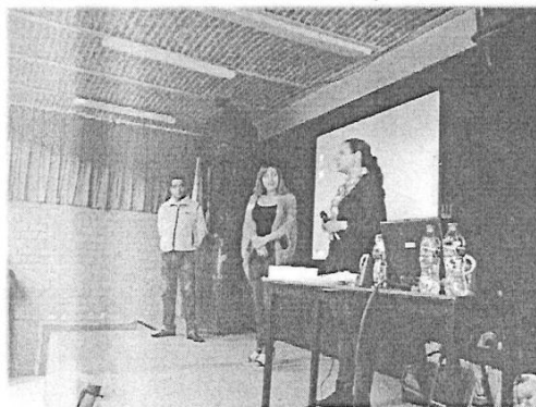
TALLERES PARA ALUMNADO DEL PLANTEL CONALEP – GUADALAJARA I

Dichas platicas, se celebraron en el auditorio S/D dentro de las Instalaciones de la Entidad Educativa, con ello se doto de herramientas de información a las y los alumnos, buscando en todo momento que visibilicen el contexto de sus emociones y sentimientos.